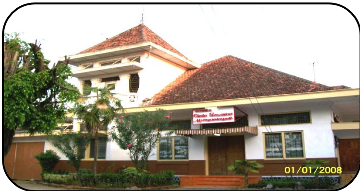
PA. "MARGANINGSIH" PUTRI - Jln. Raya Lasem No.105