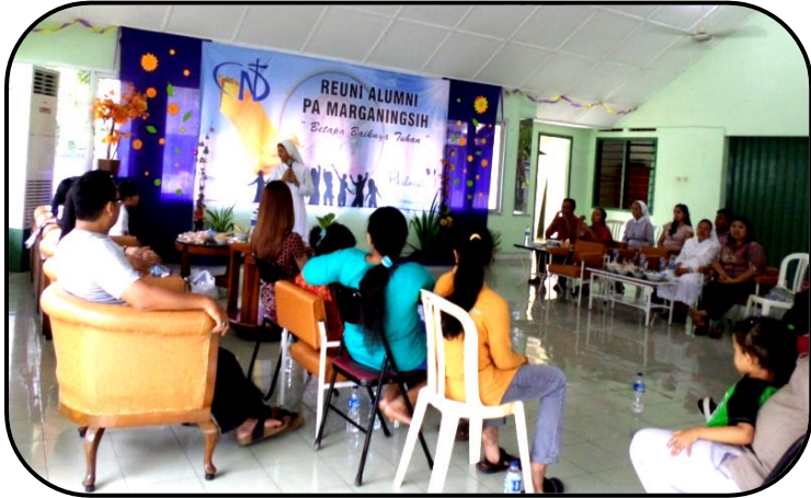
Reuni keluarga Putra/Putri Wisma Sesama Marganingsih Lasem

Reuni alumni Putra – Putri Kelurga Panti Asuhan Wisma Sesama “Marganingsih” Lasem, Jawa Tengah, yang dilaksanakan pada hari Sabtu, 25 November 2017, di aula Susteran SND jln. Veteran 31, Pekalongan. Meninggalkan kesan yang begitu mendalam. Perjumpaan antara keluarga yang satu dengan keluarga yang lain, anak yang satu dengan anak yang lain, nampak begitu akrab seperti saudara – saudari sekandung sendiri.