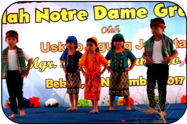
Atraksi anak-anak TK dan SD Notre Dame Puri Indah Jakarta Barat