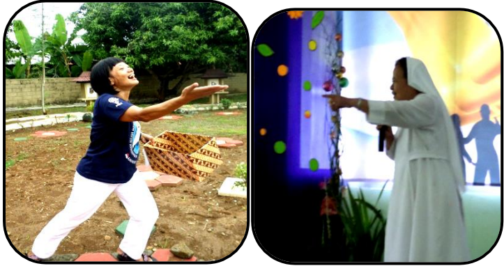
Menggoda Suster, Lihat tu kejenakaan mereka !