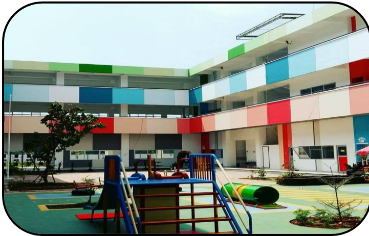
Gedung Sekolah TK Notre Dame

pertama tahun ajaran baru 2017/2018, dengan jumlah murid 18 anak