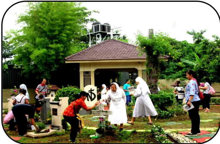
Mereka meletakkan bunga mawar di pot, mawar di kom plastik dan lilin