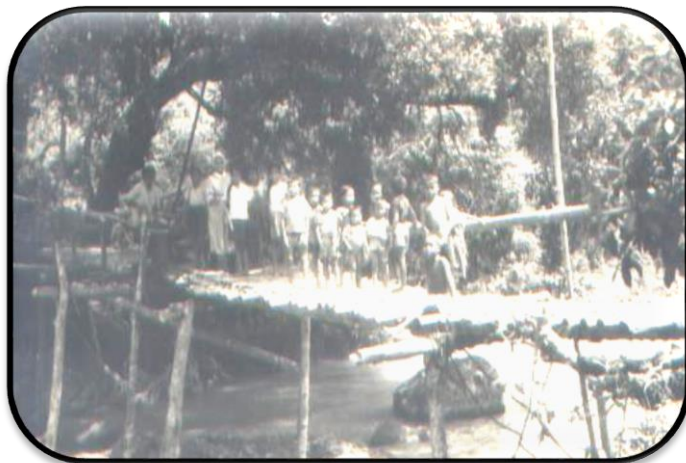
Jembatan bambu yang dilewati Suster dan Pastor

Sehingga Romo dan Suster dapat berjalan lebih ringan.