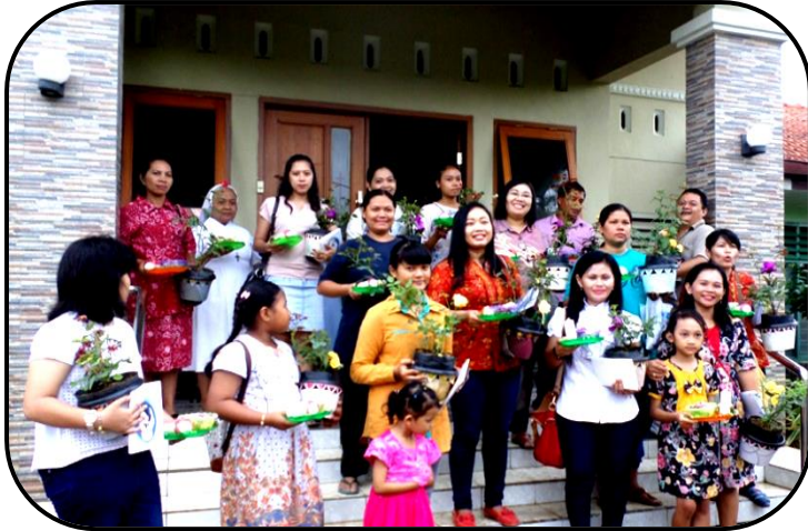
Bersiap mau profesi menuju makam