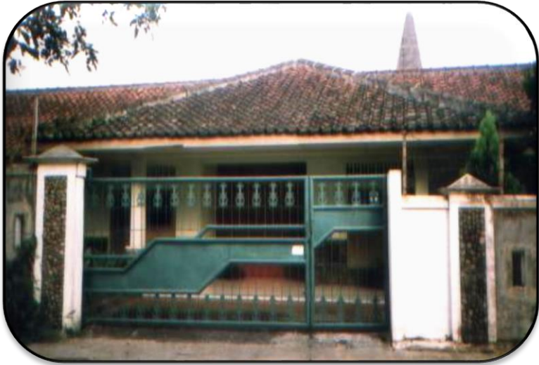
Susteran SND “ St. Yulia “ Sukorejo