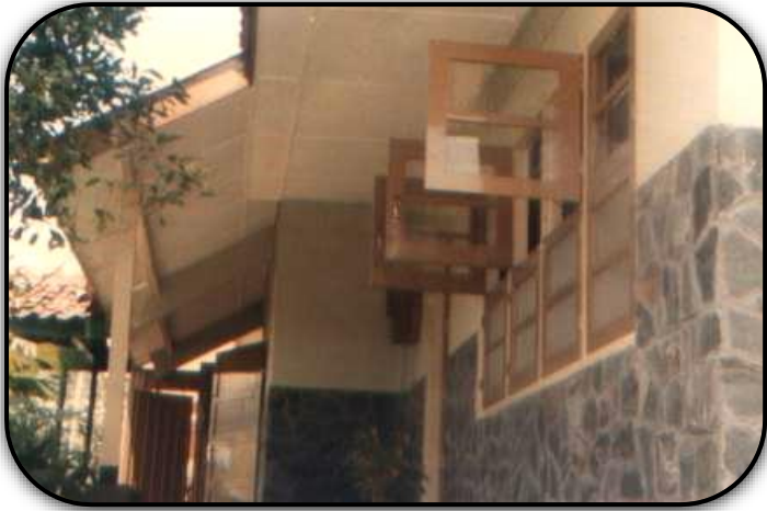
Tempat tinggal Suster pertama datang Th.1969