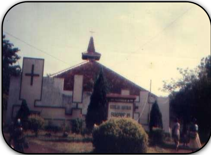
Gereja Khatolik Isidorus Sukorejo Th.1969