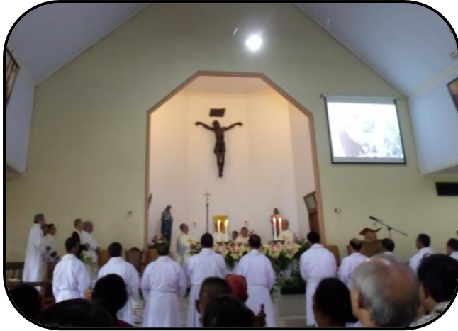
Misa Syukur 60 tahun berdirinya paroki Sukorejo