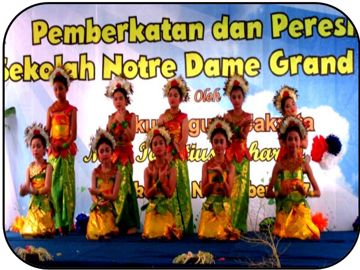
Atraksi dari Anak-anak Notre Dame