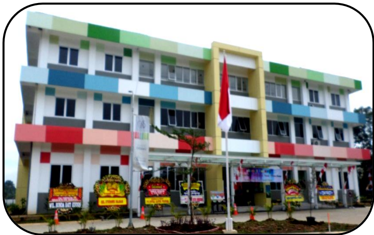
Sekolah Notre dame Grand Wisata Bekasi

Bersama Gereja yang merayakan pesta Santa Maria dipersembahkan, pada hari Selasa, 21 Nopember 2017, Kongregasi Suster Notre Dame merayakan 83 tahun perjalanan misinya di bumi pertiwi Indonesia, sekaligus pada hari itu, SND di Keuskupan Agung Jakarta, membuka Sekolah Notre Dame di Grand Wisata Bekasi.