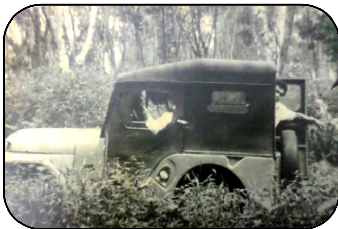
Tanahnya lengket, jalannya terjal.

yang menempel di roda mobil. Mobil terpaksa harus berhenti untuk membersihkan roda dulu. Namun demikian, semua dijalani dengan gembira hati.