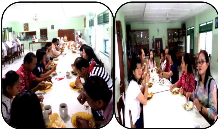
Makan pagi bersama para Suster dan doa pagi

Sesudah doa pagi, acara dilanjutkan dengan ziarah ke makam para Suster. Dengan membawa tanaman bunga mawar dalam pot, bunga mawar dalam kom plastic dan lilin, mereka berdoa Rosario, dalam prosesi dari kapel menuju ke makam Suster.